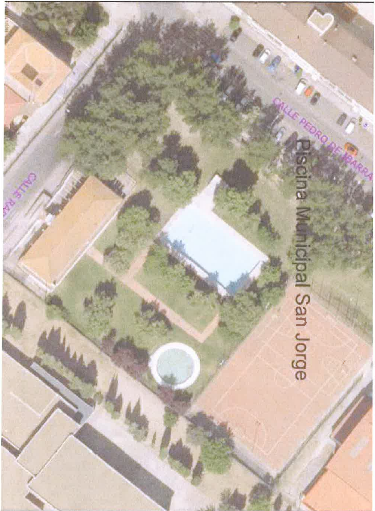
Piscina Municipal San Jorge