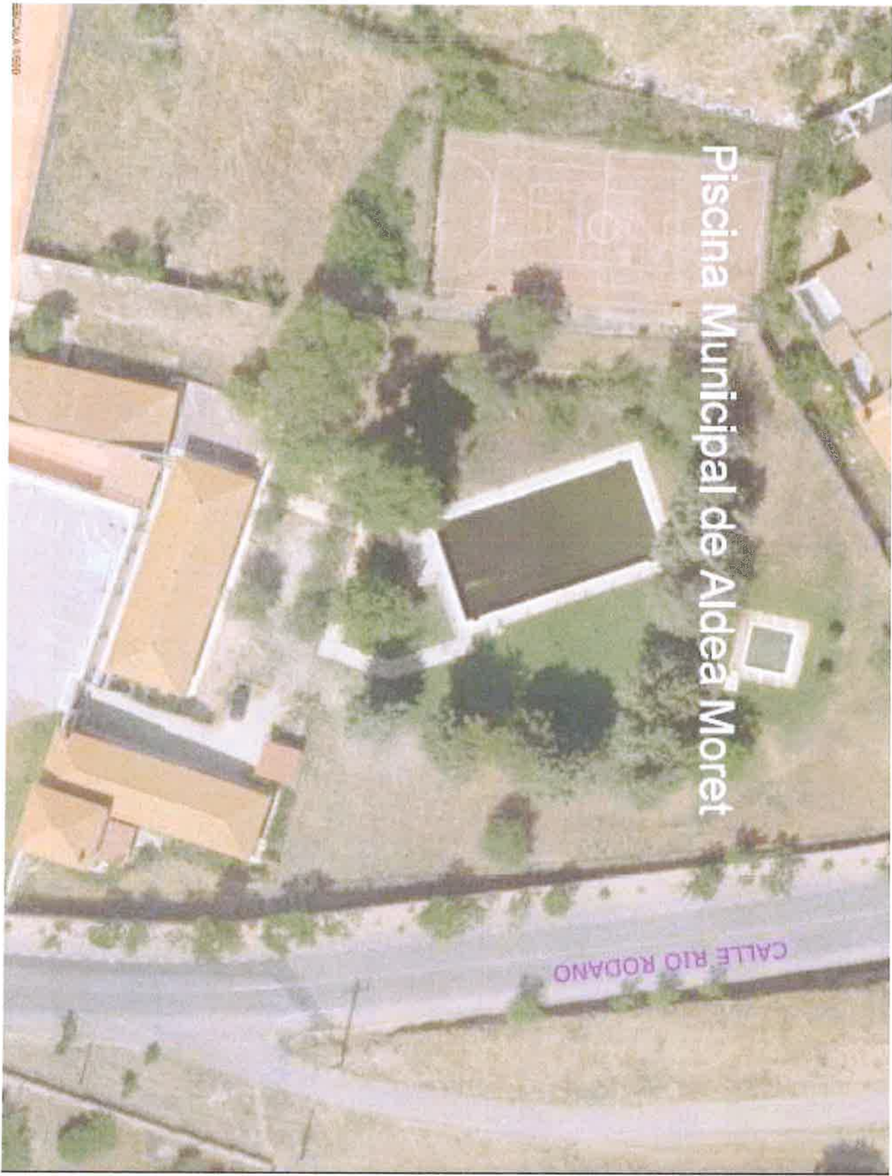
Piscina Municipal de Aldea Moret