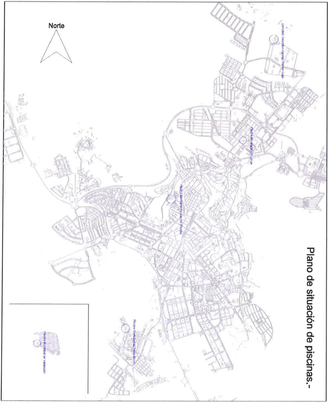
Plano de situación de piscinas.-